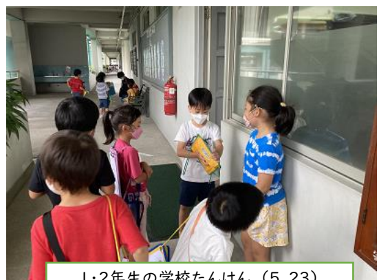
1・2年生の学校たんけん (5.23)

保健省、教育省のSOP緩和を受け、本校SOPも変更修正を行いました。学校では昨年度まで中止や内容変更していた教育活動が今年度は元の形で実施できるようになりました。これからも体験活動を多く実施したいと思います。