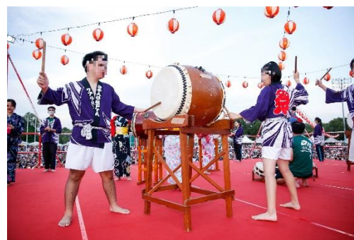
写真は2022年の盆踊り大会です。